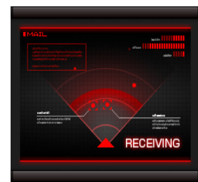
【着信、メール受信画面等】